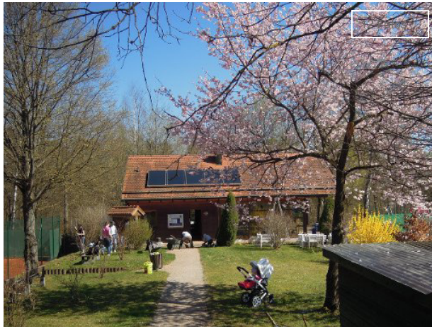
Hier wird geschrubbt und gewischt: Die Tennisspieler vom TC Weiß Blau Fideliopark räumen ihr Gelände auf.

Leserreporter Petra Hölzl, 31.03.2014 13:00 Uhr